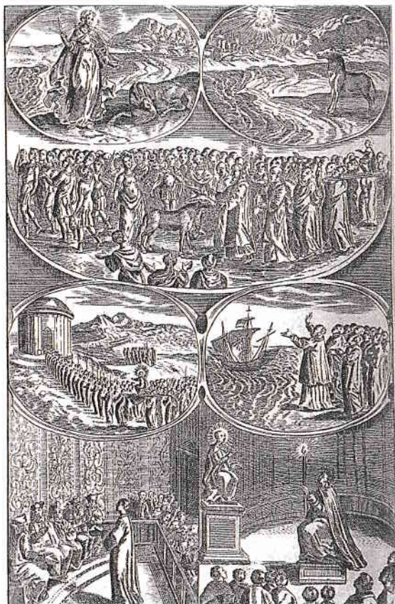
Inițiere din secolul 17 "Măgarul de Aur" - ediția franceză